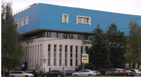
Здание ИПМех РАН

Москва, 119526, проспект Вернадского, д. 101, к. 1